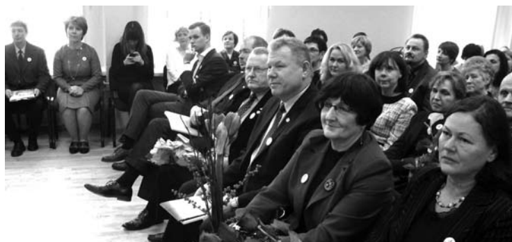
Mokyklos bendruomenę sveikino Seimo nariai, rajono valdžios atstovai, savivaldybės specialistai.