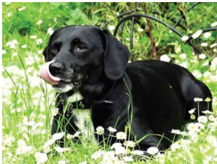
Pats šauniasis šeimos draugas - Bredas.

Rėjus tikrai ne tas katinas, kuris mėgsta būti vienas - jam reikia ne tik žmonių ir kitų katinų draugijos, bet jis puikiai sutaria ir su kitu mūsų namų augintiniu - triušyte. Rėjus ir Liza - geriausi draugai, išleidus juos kartu į kiemą, jie neatsitraukia vienas nuo kito. Tiesa, Liza mėgsta pa- žaisti gaudynių, todėl Rėjui neretai tenka ir namą kelis kartu apibėgti, kad pasivytyt savo draugę. Bet į namus jie visada grįžta kartu.