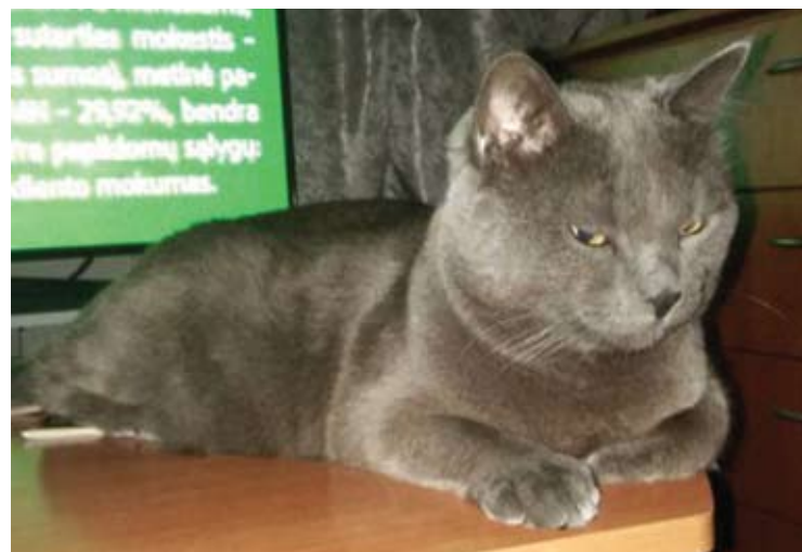
Čia Princas. Jis moka valgyti su kojytėm. O po to mėgsta ilsėtis.