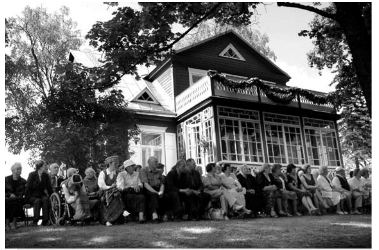
Įspūdis, kad Antano Vienuolio name–muziejuje niekas nepajudinta nuo 1957-ųjų.